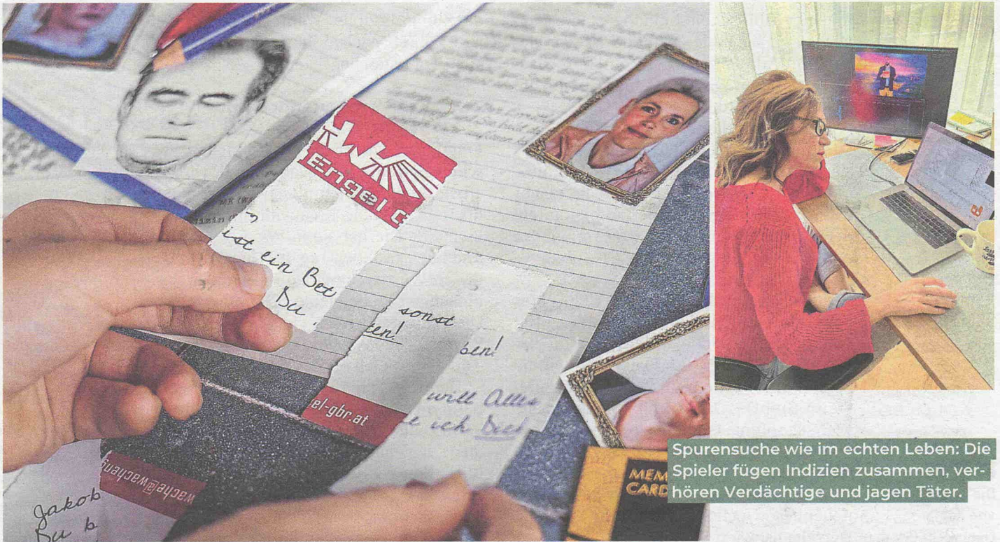
Spurensuche wie im echten Leben: Die Spieler fügen Indizien zusammen, verhören Verdächtige und jagen Täter.

unternehmens, Verträge, Paragraphen, endlose Aktenberge. „Recht bedeutet immer Probleme und Lösungen. Irgendwann wollte ich etwas machen, das mein Herz erwärmt.“